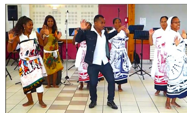
Photo du groupe Valiha

Prochaine exposition d'hiver du 13 au 22 décembre 2024 à Auray. Pensez déjà à réserver un créneau pour assurer une permanence. Merci.