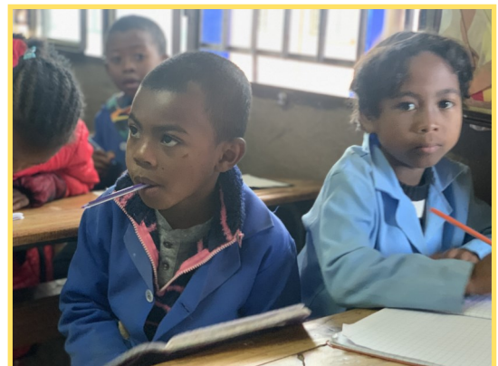
Retour aux apprentissages : lire, écrire, compter en malgache et en français