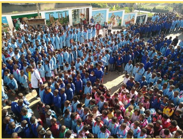
La rentrée est très attendue par les jeunes et leurs familles